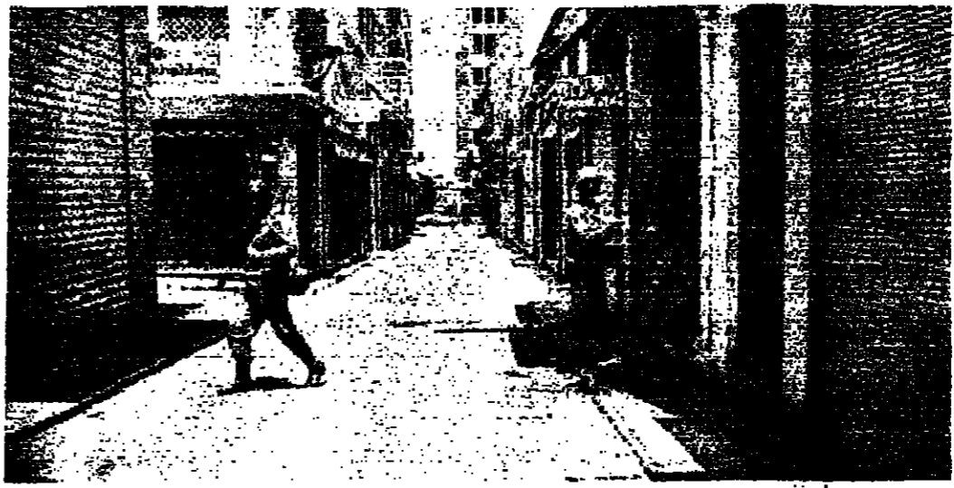
محلات مغلقة .. ورجال أمن يولون الحراسة

التامة من الخلل . اقفال المصارف واستمر اقفال المصارف ، رغم ان بعضها فتح ابوابه لفترة قصيرة تسمى الصباح ، لكن عدم حضور الزبائن أدى الى اقفالها من جديد كلاك تحت بعض شركات السياحة والسفر ابوابها ، ومطعم القاهي والمطعم في شارع الحمراء حيث ازديحت زبائن . اما شركات القطاع الخاص ، فقد استلقت قسم منها اصعاقه بمسورة جزية حتى الظهر ، واقصر العمل على المعاملات المكسة ، دون وجود أي نشاط تجاري ملحوظ . وشهدت المحلات التجارية التي تحت ابوابها امس ، توتفنا كثيرا من المواطنين على شراء المواد الغذائية مما أدى الى نقص ملحوظ في الكميات المعروضة ، وتمتد نسبة فتح المحلات ١٠ و ٢٠ بالمئة . بينما كان اقفال شلالا في شوارع عديدة ، خاصة في قلب المدينة . وبالنسبة لحركة السير ، كانت خفيفة في ساعات الصباح ، واقترت الشوارع من السيارات والمارة منذ فترة الظهر . ولوحظت حركة شبه عادية في سوق الخضار ، حيث كانت السيارات الكثيرة تنزع حولتها من الخضار والفواكه لنهاية تلبية لطلبات المحلات والمستهلكين .